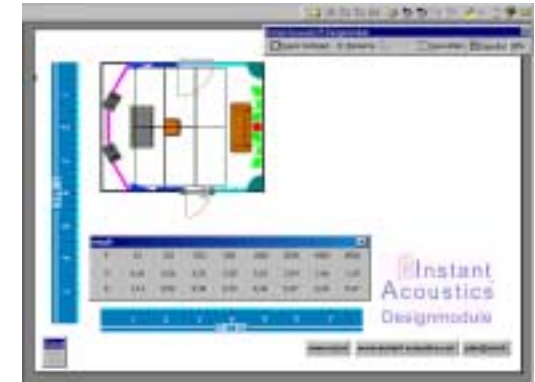
Abb.7: Der fertig eingerichtete Raum