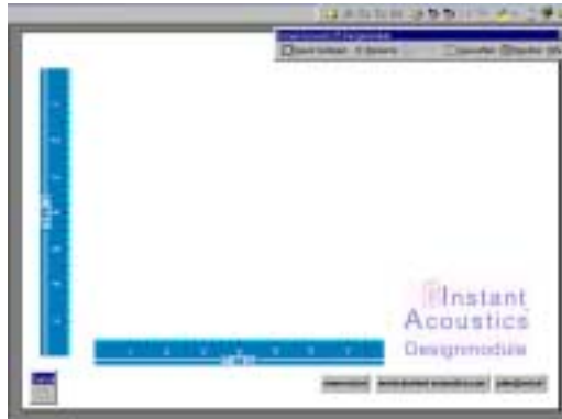
Abb.1: Die Programmoberfläche nach dem Start

Wählen Sie in der Menüleiste „Raum festlegen“ und geben Sie in der Dialogbox Länge, Breite und Höhe Ihres Raumes ein. Dann erscheint der Grundriß Ihres Raumes auf der Zeichenoberfläche.