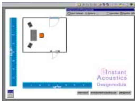
Abb.5: Der Raum mit Fenster, Türe, Mischpult,..

Unter dem Menüpunkt „Elemente“ finden Sie Karteikarten auf denen Sie verschiedene Einrichtungsgegenstände wie Mischpult, Lautsprecher, Sessel, Türe, Fenster, etc. für Ihren Raum auswählen können.