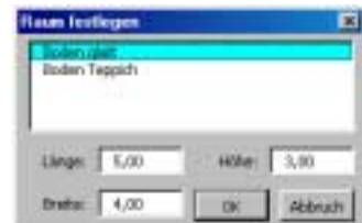
Abb.3: Dialogbox „Raum festlegen“